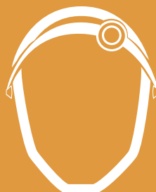
Figura 1. Posición de bobina para Depresión.